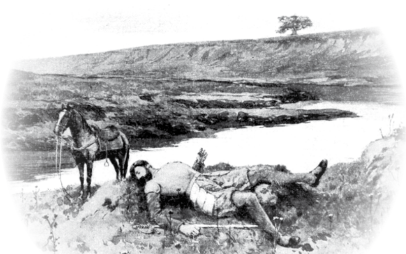
Capitán Pedro de Luján, muerto a orillas del río al que dio su nombre